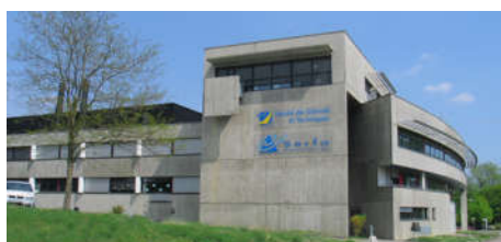
FST n°18 Bâtiment K